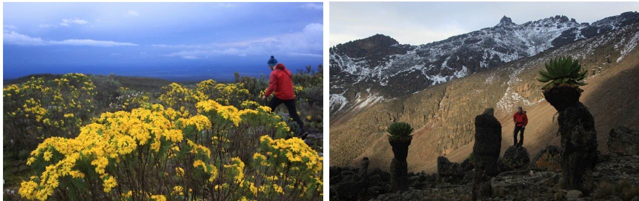
Bilder (l.n.r.): Sirimon Route bei Old Moses, zwischen Senezien bei der Umrundung