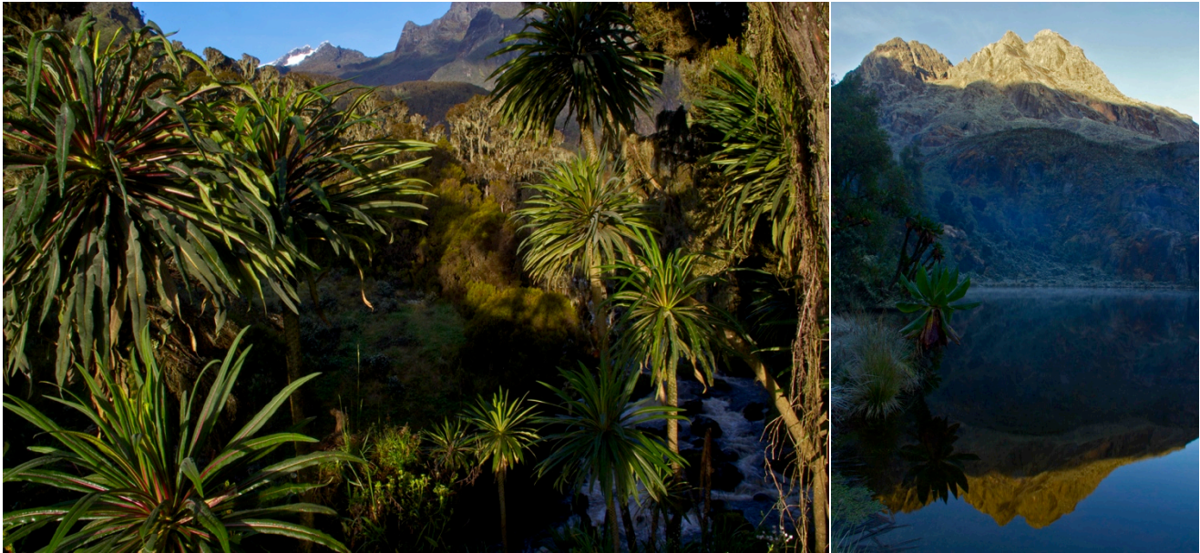
Bilder: Mount Stanley von der John Matte Hut gesehen (links), der Lake Kitandara (rechts).

Das einmalige Naturerlebnis im Herzen Afrikas