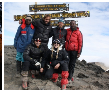
Impressionen beim Ausstieg über die Rongai-Mawenzi Route