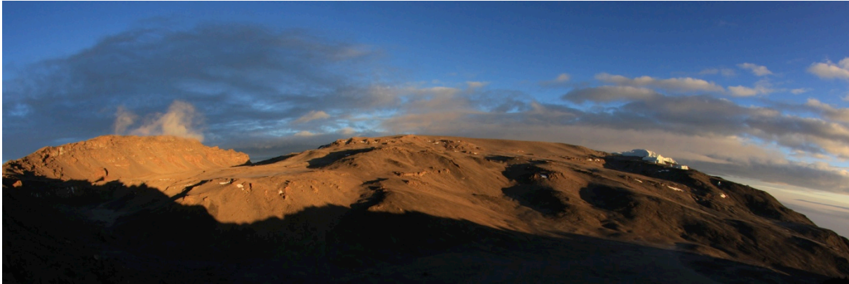
Das Kilimanjaro Gipfelplateau vom Gilman's Point nach Aufstieg über die Rongai Route.

Besteigung des höchsten Berges Afrikas über die Rongai-Mawenzi Route - der bequeme Weg zum Gipfel (Tansania, 9 Tage)