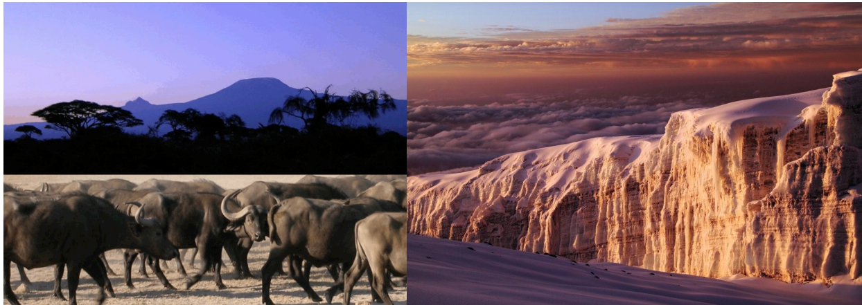
Bilder: Kilimanjaro, Büffel im Arusha Nationalpark, Gletscher am Gipfel – alles in einer Reise.

SummitClimb Naturerlebnis in Tansania, Trekking zum höchsten Berg Afrikas