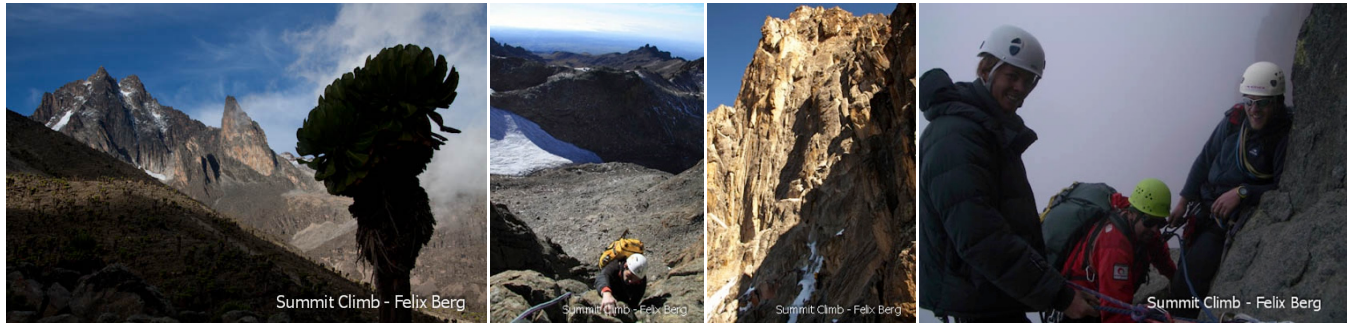
Links: Mount Kenia Südseite, rechts auf dem Normalweg zum Nelion

Klettern: Die Hauptgipfel Nelion (5188m) und Batian (5199m) können eigenständig mit Partner oder mit einem Bergführer bestiegen werden. Mit Kletterrouten ab dem 4.UIAA Schwierigkeitsgrad bis zu extremen Abenteuer-Routen bieten die bis zu 700 Meter hohen Wände ein Felskletterparadies aus bestem Gneis Gestein.